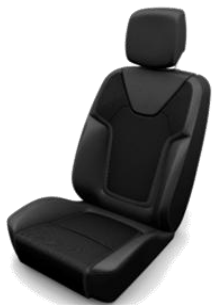
DRAP21 (Standard pe versiunea Intens)

Tapiterie mixta velur de culoare Negru/ Rosu/Gri: